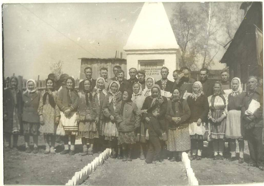
ВЕТЕРАНЫ Вел. Отч. войны и ВЕТЕРАНЫ ТРУДА с. КУЛЕГАШ. В ДЕНЬ ОТКРЫТИЯ ПАМЯТНИКА.