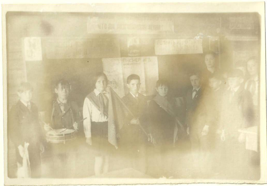
Отрядной сбор посвященной герою, которая носит отряд.